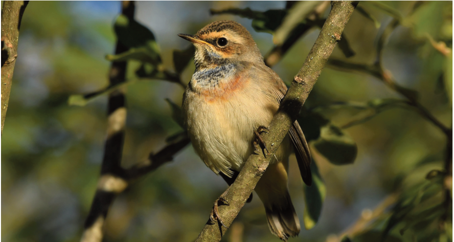
Blåhake.