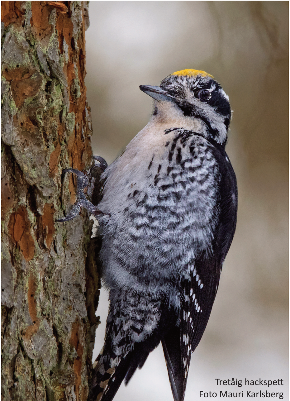
Tretåig hackspett