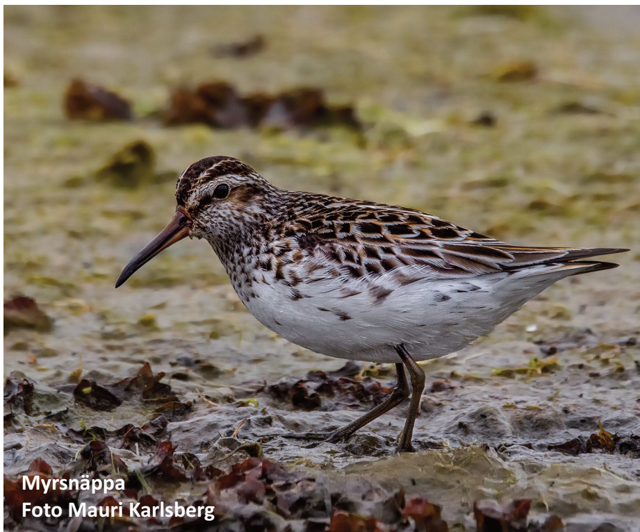
Myrsnäppa