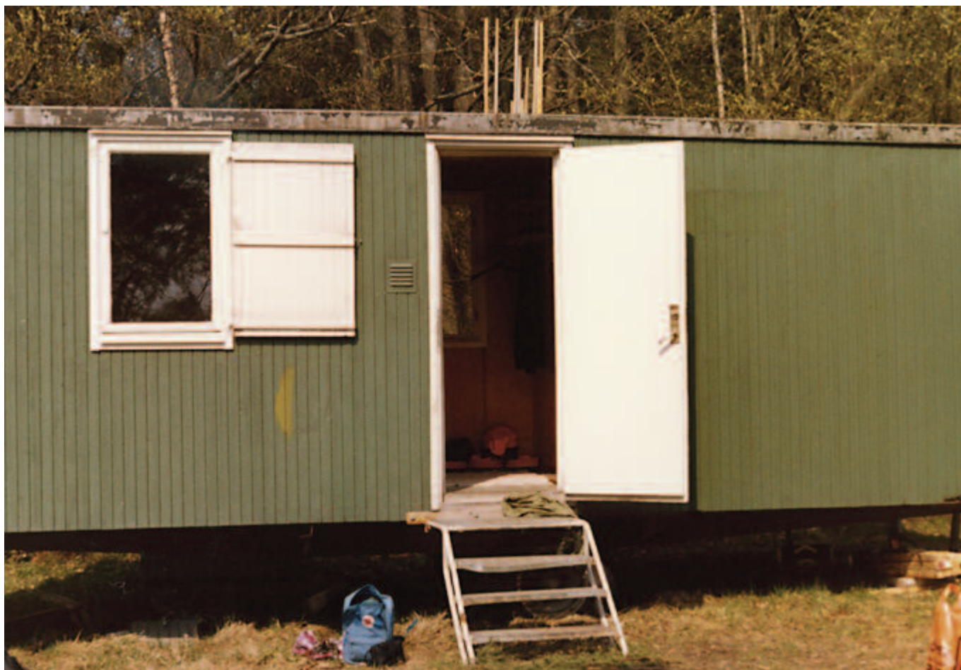
I projektet inköptes en utdömd manskapsbod från Oxelösunds kommun av Tärnan och Oxelösunds fältbiologer. Den rustades upp och kunde sedan användas året runt.