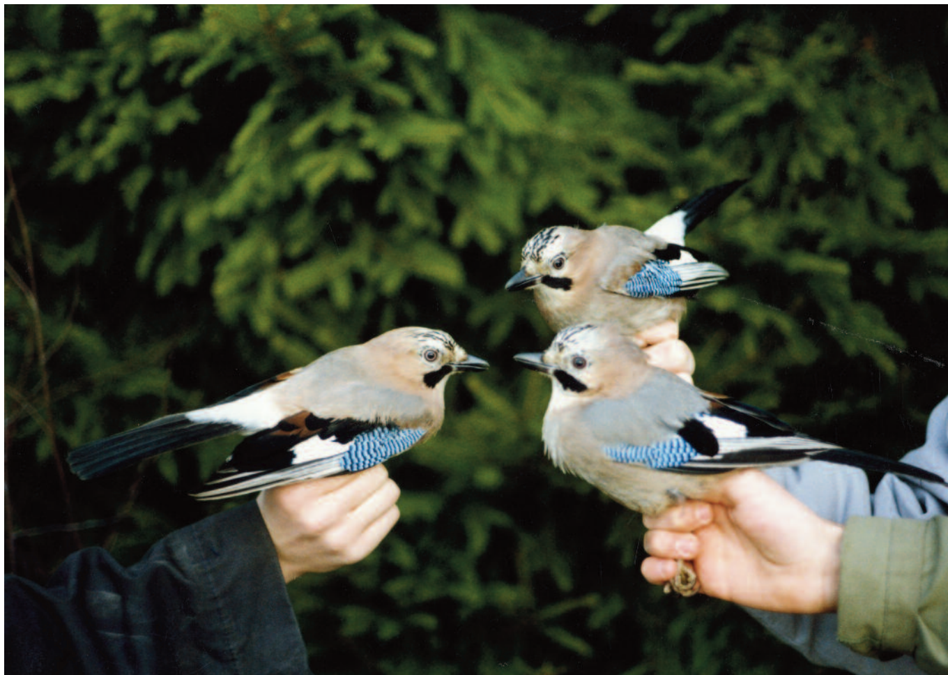
Triss i nötskrikor.