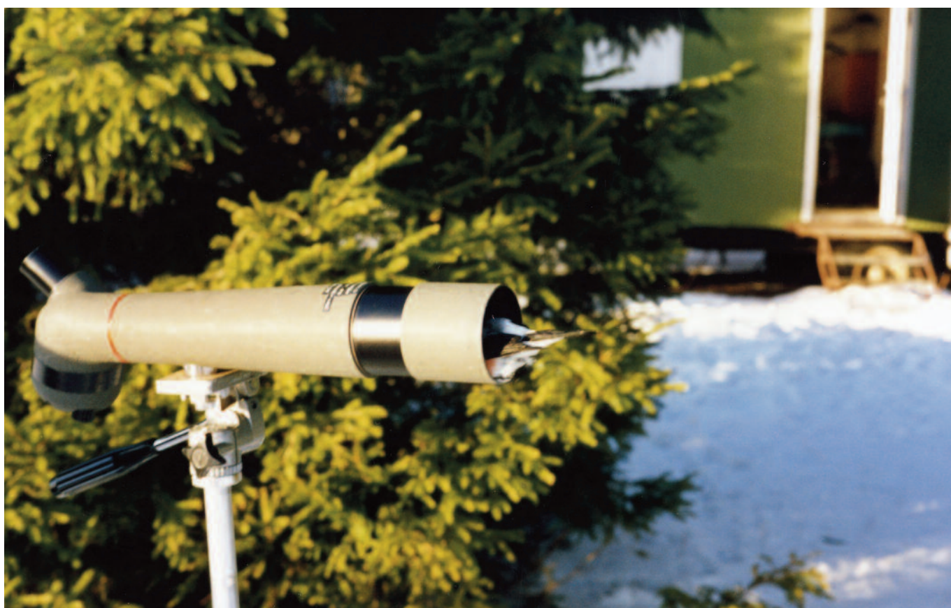
En domherre som gärna vill synas i tubkikaren.